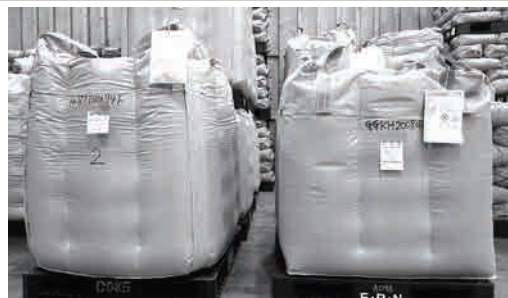
(左 1200kg) (右 1020kg)

使いやすい千二百kgのフレコンの在庫がひっ迫し四百枚ほどしかありません。お盆明けに中国製の袋メーカーから納入の予定でしたが、十月以降にずれ込むとの連絡を受けました。これは世界的なコンテナ不足の影響です。国際貨物運賃が急騰にも繋がっています。