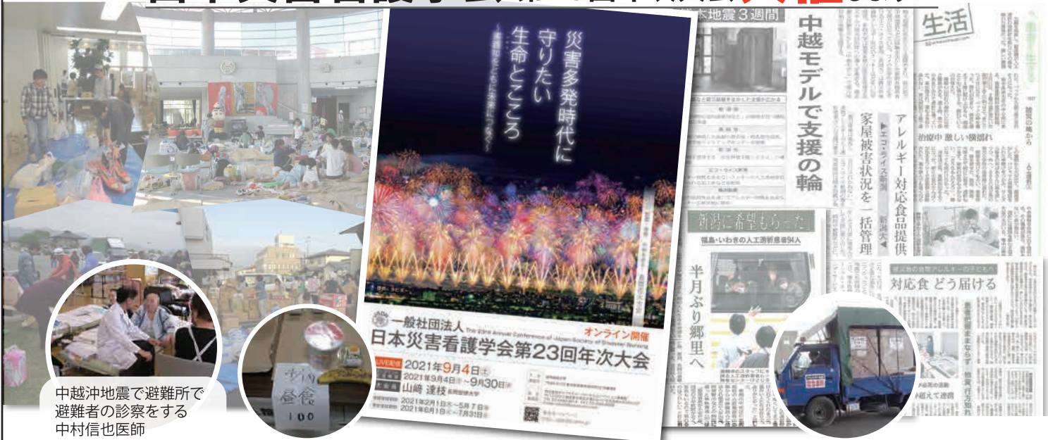
中越沖地震で避難所で 避難者の診察をする 中村信也医師