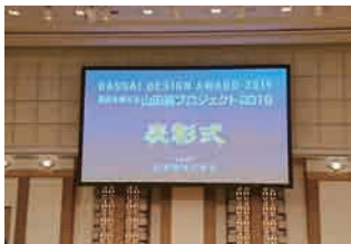
令和元年の表彰式

(日本語名)もしくは「Dassai Beyond the Beyond」(英語名)がシリアルナンバー付きで製造。