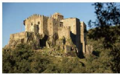
バンタドゥー城 (château de Vantadour)