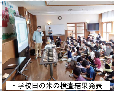
・学校田の米の検査結果発表