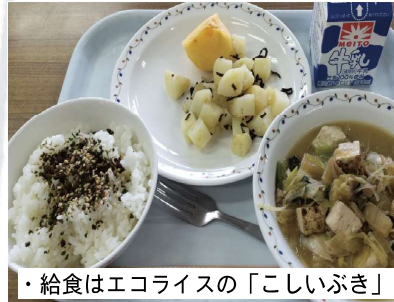
・給食はエコライスの「こしいぶき」