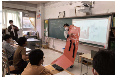
・折りたためて軽いレスキューボードを説明