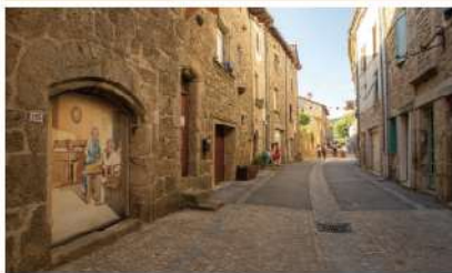
故郷のメインストリート！