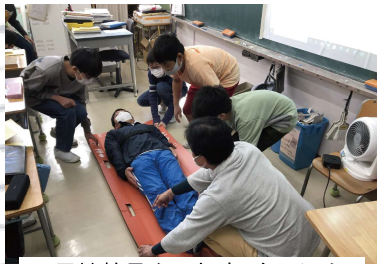
・男性教員を6年生4名で運ぶ