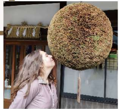
「景虎」の酒林 (新酒を醸したるしの香りをかぐ)