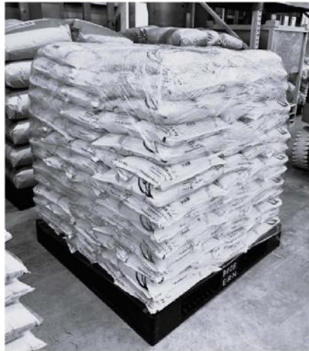
1パレットに米を800kg以上!

お米だけで10トンを超え、輸出日直前まで精米作業となりましたが、無事に輸出できました!