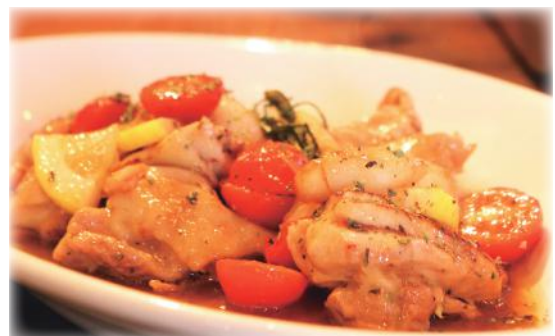
ミード酒を利用した鶏肉焼き

照りやデザート、カクテルでもはちみつの香りと甘さが残り、さっぱりして洋食などにととても合います。