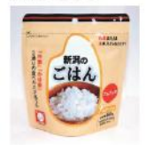
当社の非常食ラインアップ