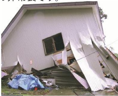
中越地震での被害