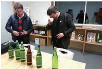
火災から復活の加賀の井酒造で試飲