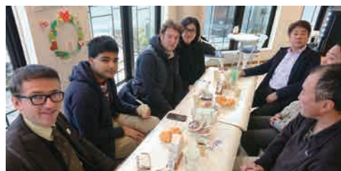
ガトウ専科で米粉グルテンフリースイーツ試食