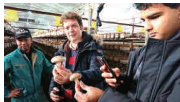
南魚沼のしいたけ生産者の視察