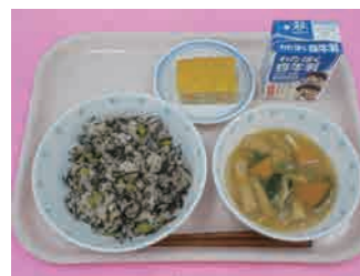
枝豆ひじきごはん