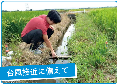
台風接近に備えて

籾種にマイコス菌(菌根菌)を接種することにより、根を活性化させて水無し技術で栽培するお米のこと。田植機を使用せず、苗の準備も不要という画期的な技術。