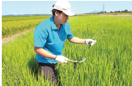
ノビエを鎌で刈取