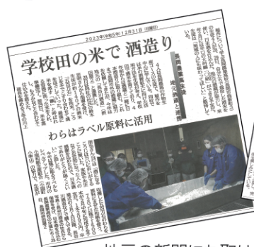
地元の新聞にも取り上げられました