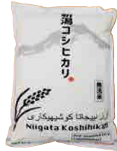
新潟県産コシヒカリを積み込み中