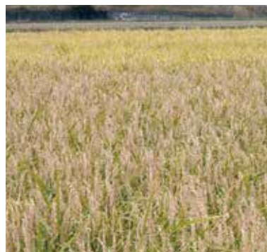
イモチ病の山田錦