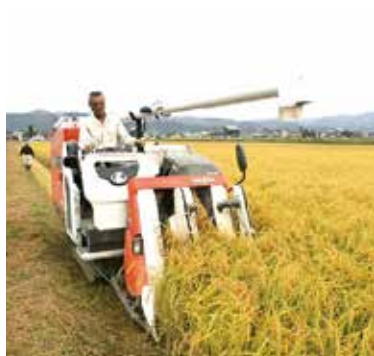
魚沼市堀之内の収穫風景

今年はお盆を境目に、猛 暑から一転して長雨・低温 という極端な天候で、山田 錦の生育にも大きく影響し ました。 1 圃場の中での生育のバラ つき 2 藁のわきによる生育のバ ラつき 3 肥料過剰によるイモチ病 発生 があり収穫時期は慎重な見 極めが必要です。