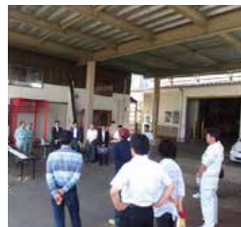
第1回検査員研修の様子