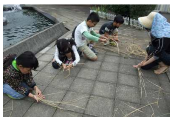
木槌が重い！何度も叩きます。