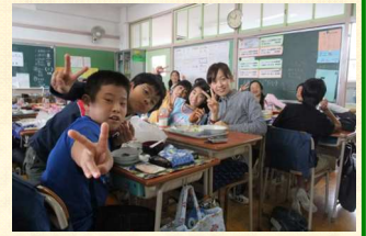
焼いた米粉クッキーを食べました