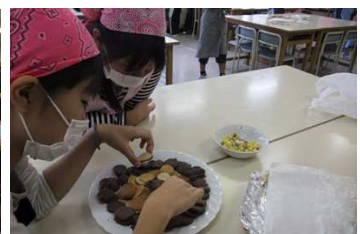
綺麗に焼きあがったクッキーと米粉マカロニ。上手にできました。