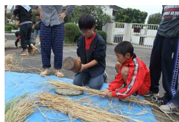
藁を叩いて編み易くする。しかし、柔らかくなった藁を捻りながら巻いていきます。結構、難しい！