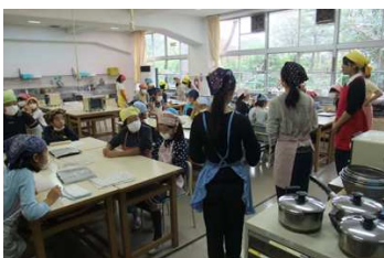
緊張しながらクッキー作りの手順の説明。初めての体験で緊張！