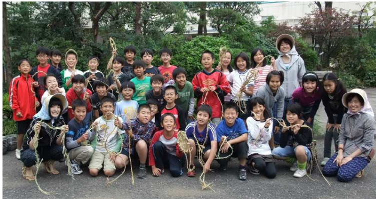
正味80分の授業に盛り沢山の企画。学生は白藤合宿で自ら編上げたワラジを履いています。一緒に体を動かさず事で一体感が醸成されました。