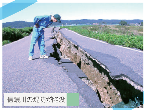
信濃川の堤防が陥没

ERN 有限会社エコ・ライス新潟 新潟県長岡市脇川新田町字前島970-100 TEL 0258(66)0070 FAX0258(66)0447 URL http://www.eco-rice.jp/ E-mail office@eco-rice.jp