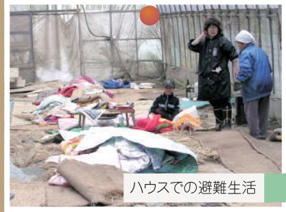
ハウスでの避難生活