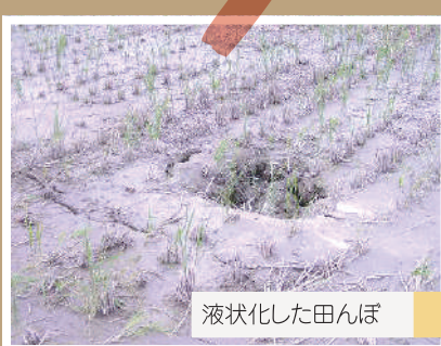
液状化した田んぼ